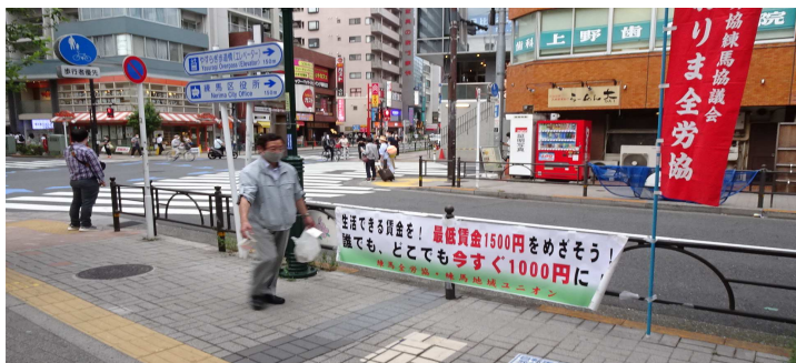
西武池袋線 練馬駅西口 りそな銀行前での宣伝、ビラ配布 2021年7月26日 17時50分撮影