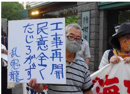
(写真は6月15日：辺野古工事再開抗議！防衛省前)